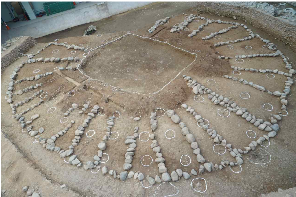
〈돌무지 기초부의 돌렬 및 흙둑(위-서쪽)〉