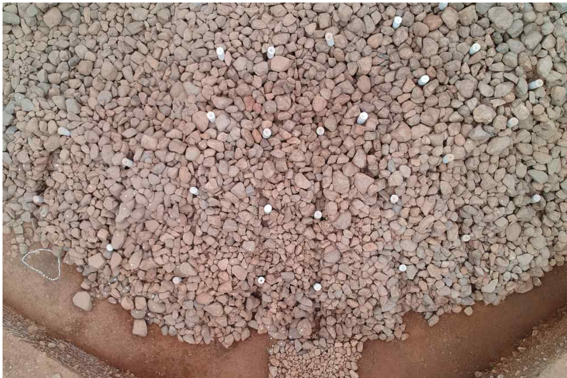
<돌무지 표면에 나무 기둥과 버팀나무 흔적(위-서쪽)>