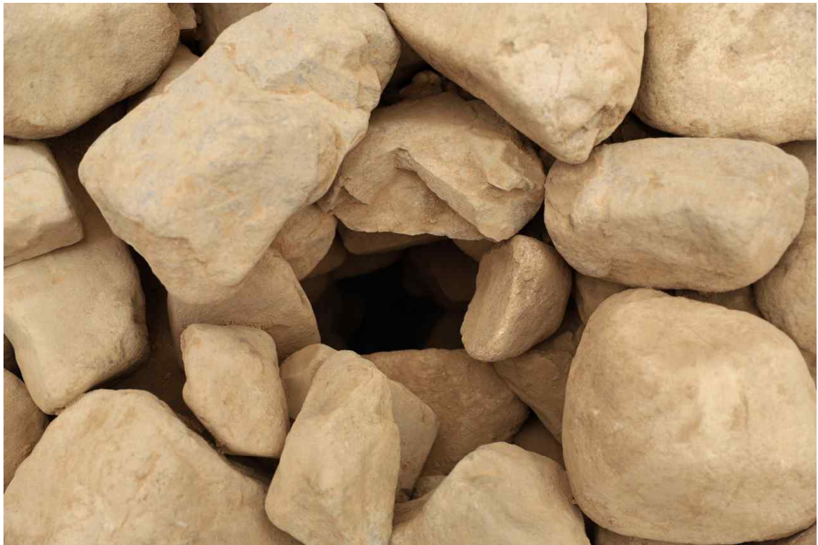
〈돌무지 내 나무 기둥 흔적 세부〉