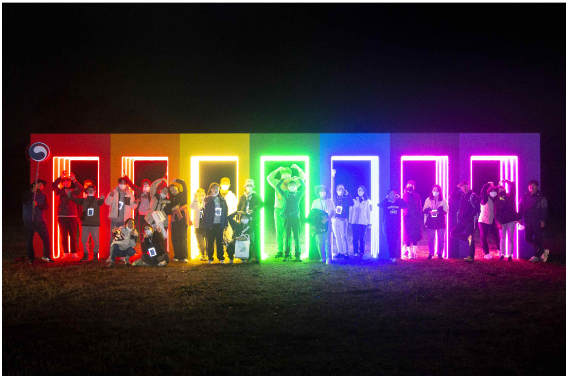
< 2022년도 ‘빛의 공퀵 월성’ 현장 사진 >