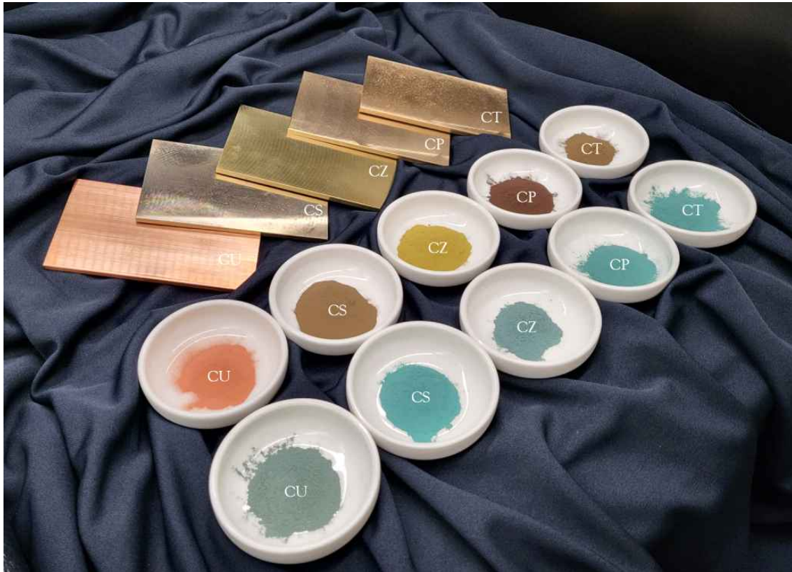
<전통 인공 무기안료 동록(銅綠)의 원료(동판 및 동분말)와 재현 안료>