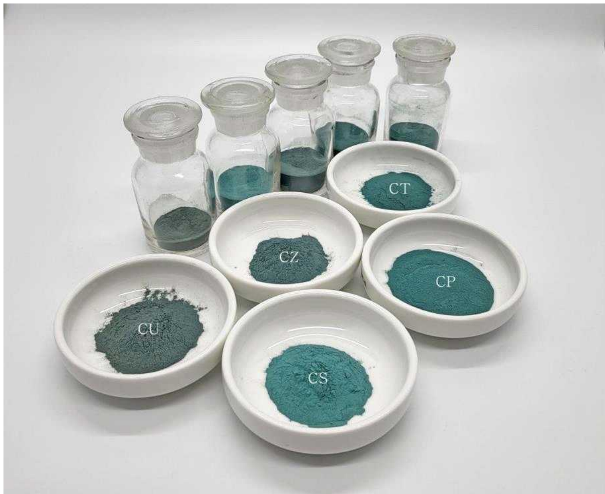
<전통 인공 무기안료 동록(銅綠)의 재현 안료>