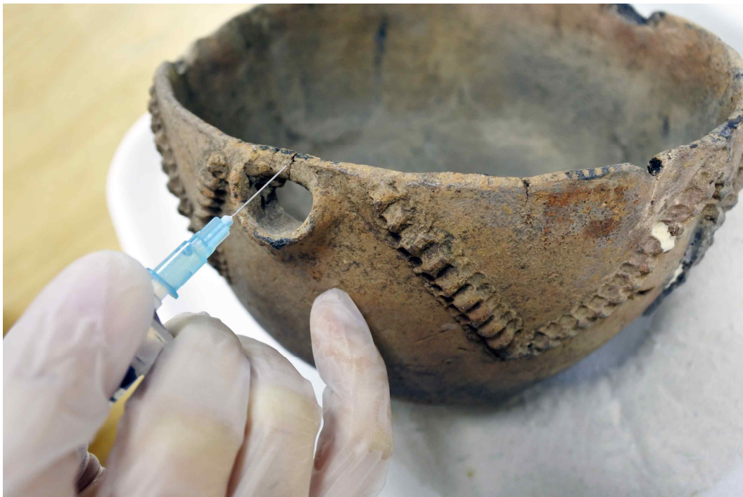
<‘토기 용기문 발’의 균열 부분 보강처리 모습>