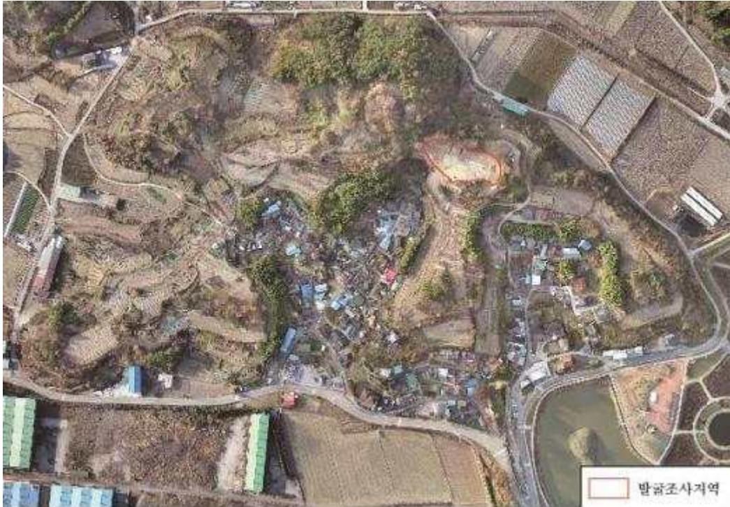
<함안 가야리유적 전경(남쪽에서)>