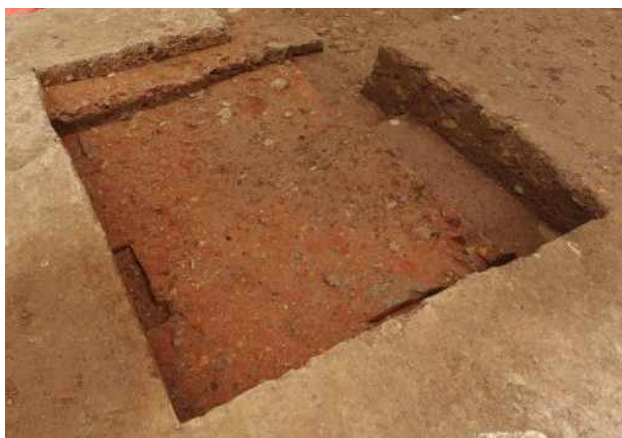
<토성벽 상부 달구질 흔적 노출모습(서쪽에서)>