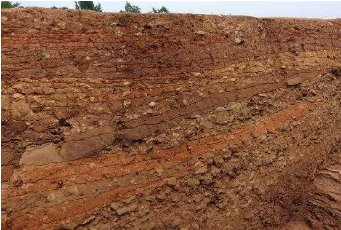
<중심토루 축조 모습(북서쪽에서)>