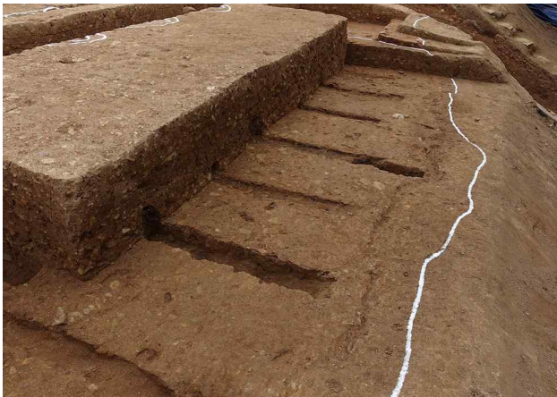
<토성벽 상부 횡장목 노출모습(동쪽에서)>