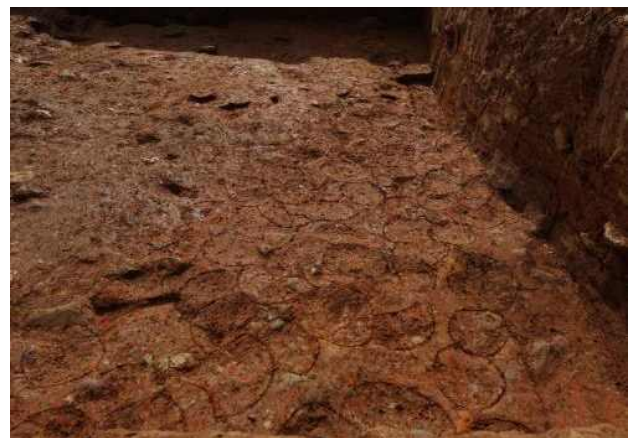
<토성벽 상부 달구질 흔적 노출 세부>