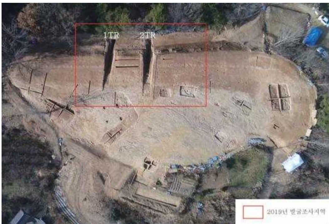
<함안 가야리유적 조사지역 전경(남서쪽에서)>