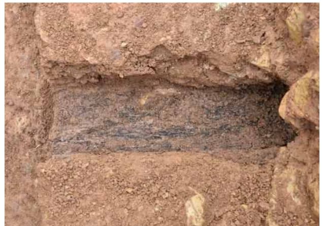
<토성벽 상부 횡장목 목질흔 세부>