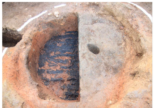
<하층(5호로, 왼쪽)과 중층(16호로, 오른쪽) 제련로 목조시설 전경>