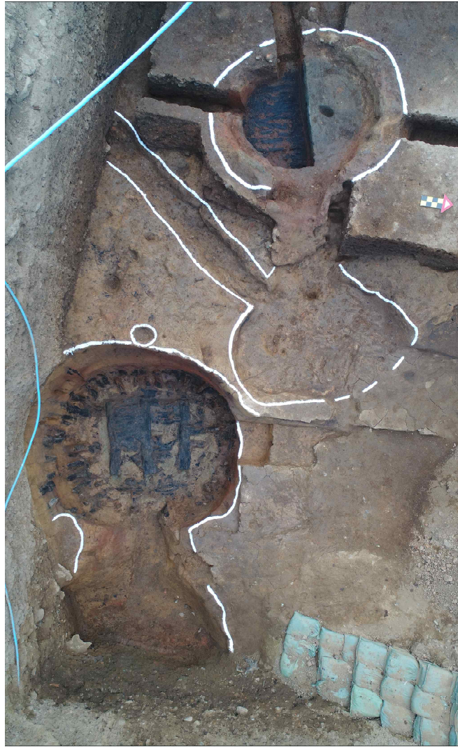
<하층 유구(5호로, 아래쪽)와 중층유구(16호로, 위쪽) 전경>