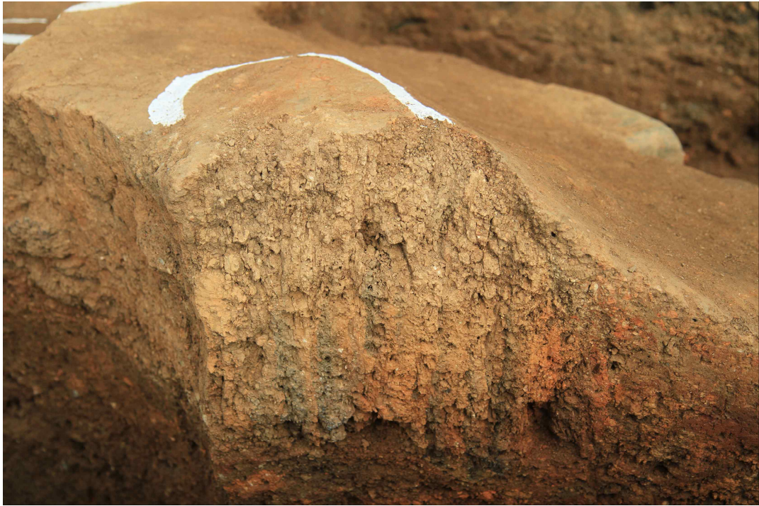
<최소 8회 이상 조업한 노벽(13호로) 단면 모습>