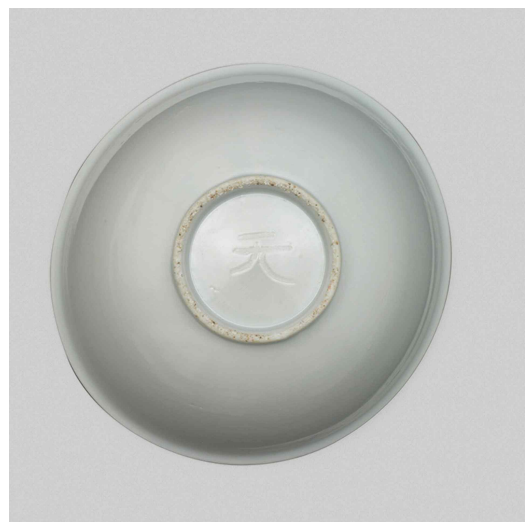
그림2-1. 굽바닥에 새겨진 ‘천(天)’