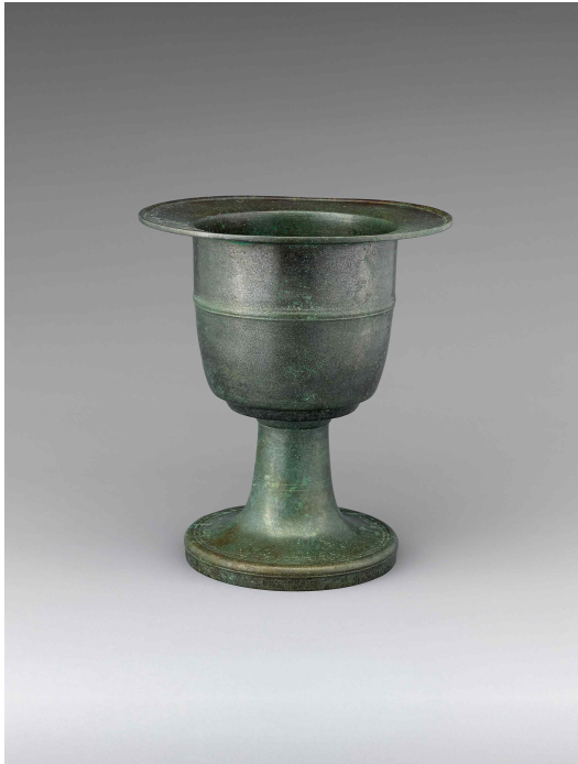
그림 1. ‘무자(戊子)’가 새겨진 청동 향완, 고려