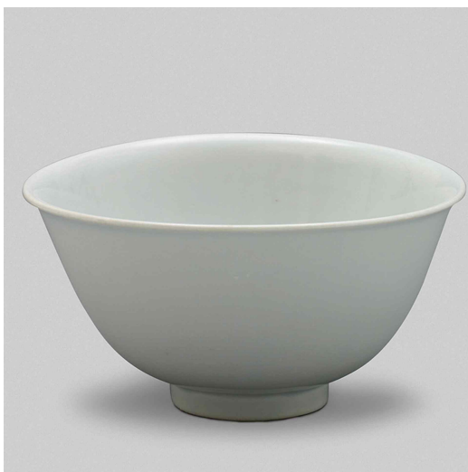
그림 2. ‘천(天)’이 새겨진 백자발, 국보, 조선