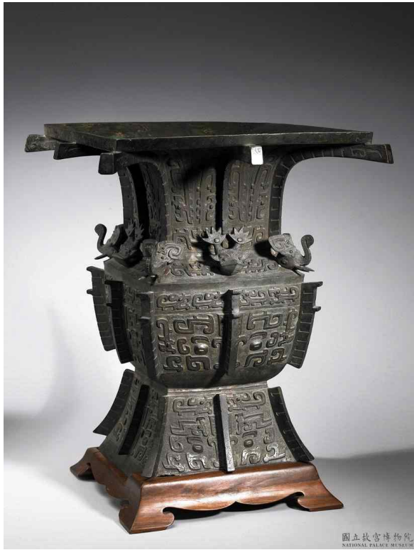
그림 3. ‘예공(芮公)’ 이 새겨진 청동기, 춘추(春秋)시대, 대만 국립고궁박물관