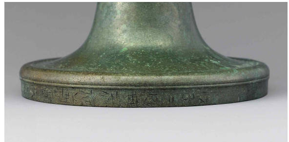
그림 1-1. 굽다리에 새겨진 ‘무자(戊子)’