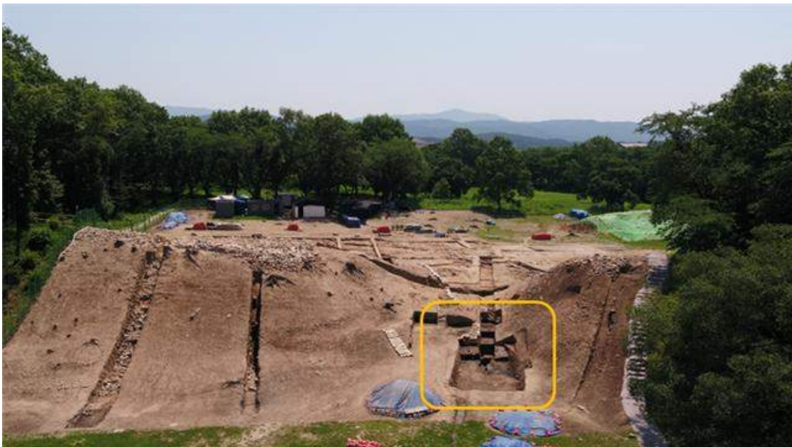
<2020년 월성 발굴조사 구간과 서성벽 전경>