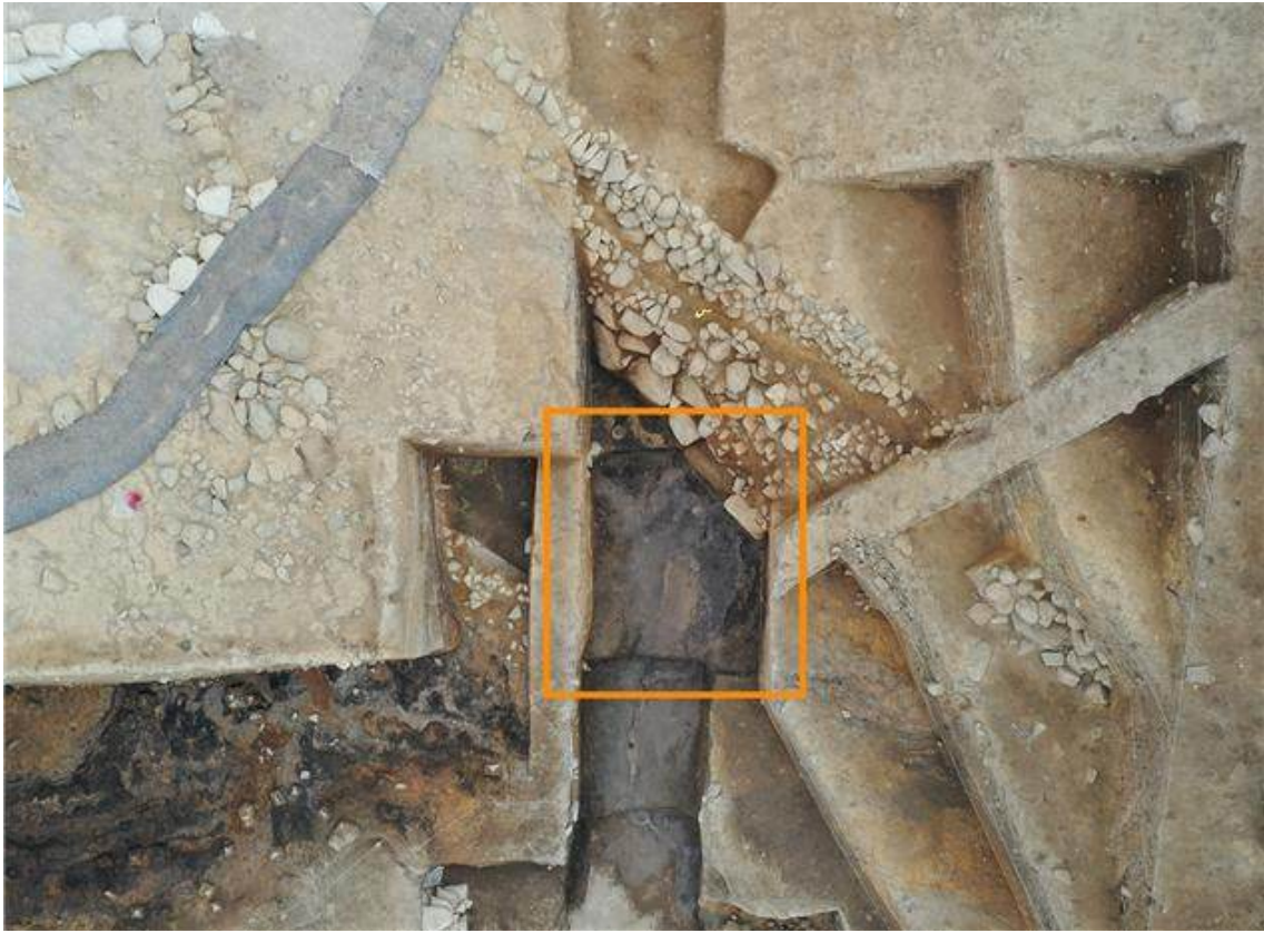
▲ 월성 서성벽 인골 출토 지점