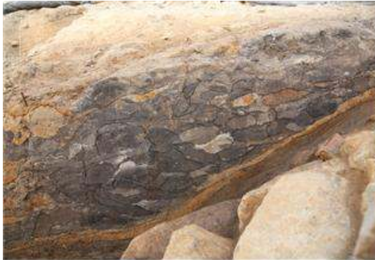
▲ 흙덩어리를 재료로 쓴 토냥 공법