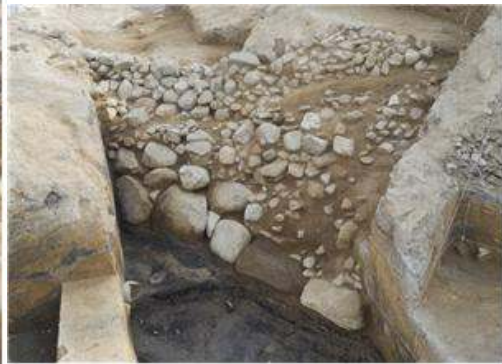
▲ 체성부 내부에 존재한 석렬