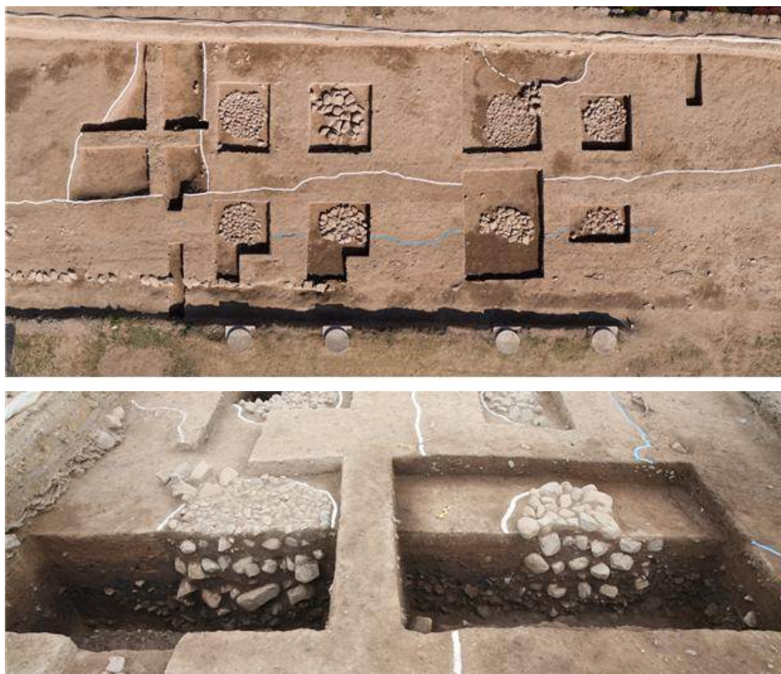
▲ 통일신라 시대 적심건물지 전경과 토층 세부