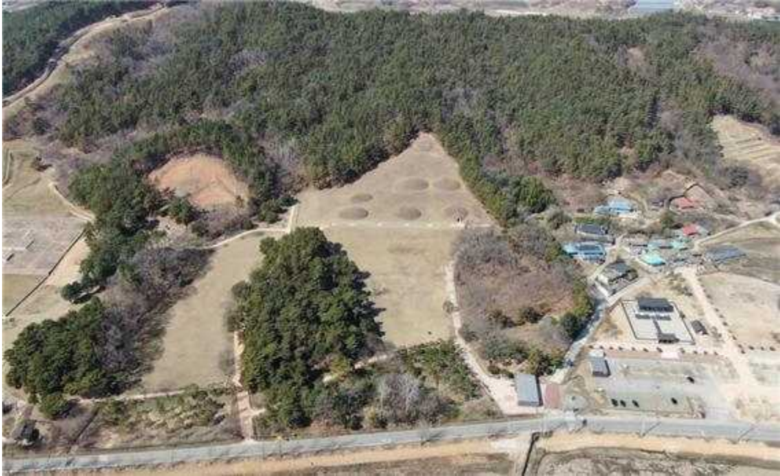
〈부여 능산리 고분군 항공사진〉