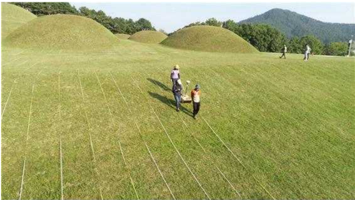
〈부여 능산리 고분군 지하물리탐사 전경(2019년)〉